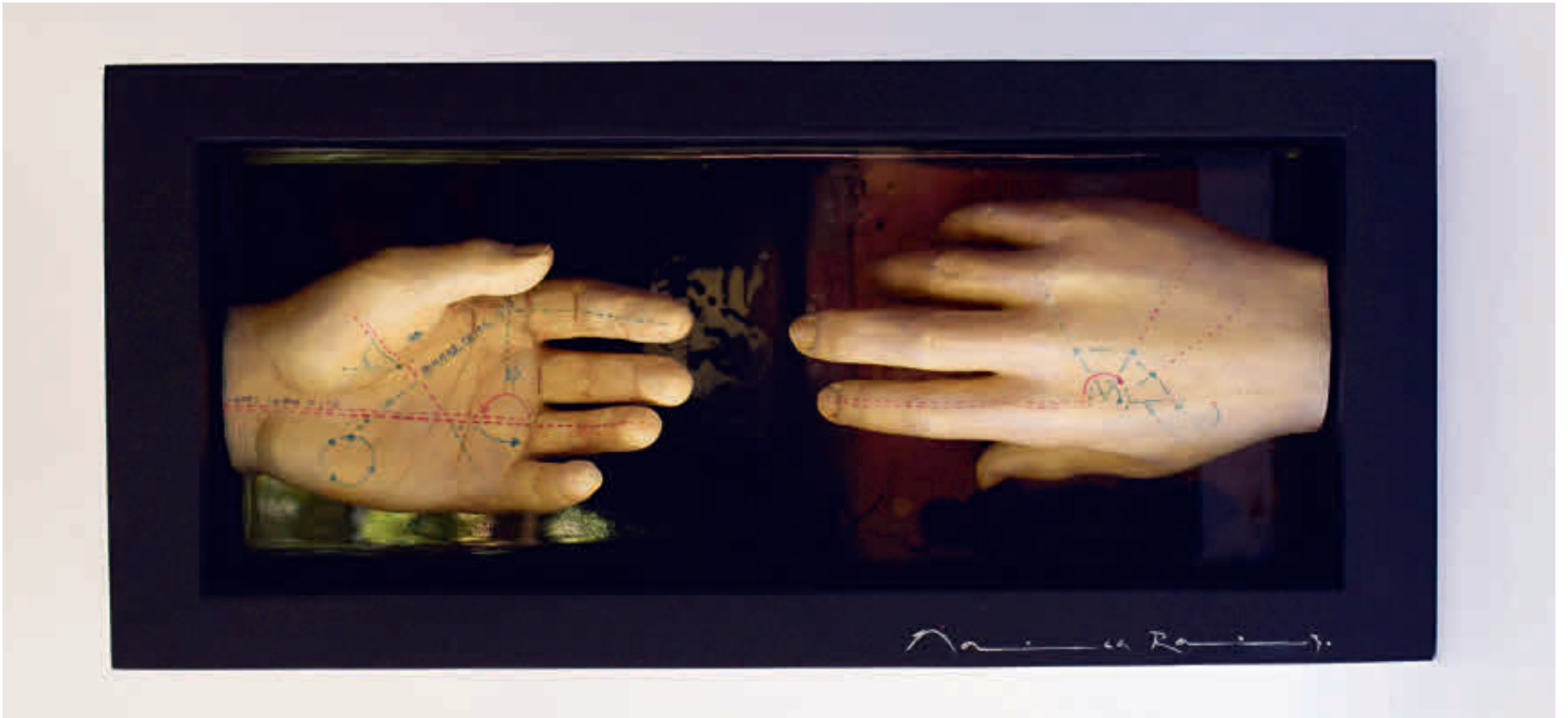
Obras de la serie Hilos atávicos , de Mónica Ramírez.